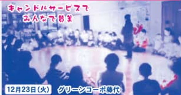
12月23日(火) グリーシコーポ藤代