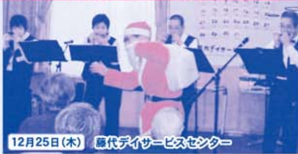
12月25日(木) 藤代デイサービスセンター