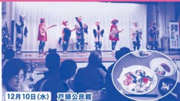
12月10日(水) 戸頭公民館