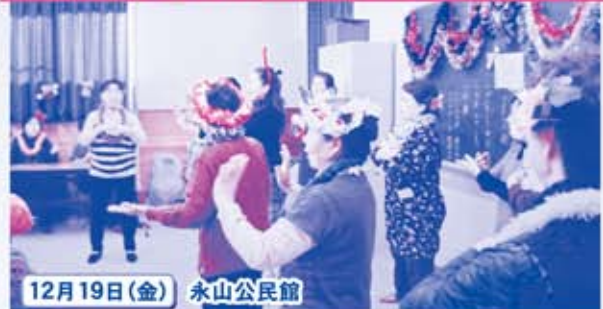
12月19日(金) 永山公民館