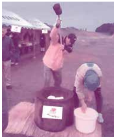
地域でもちつき大会(やえすげん氣会) 12月13日八重洲ニュータウン自治会館