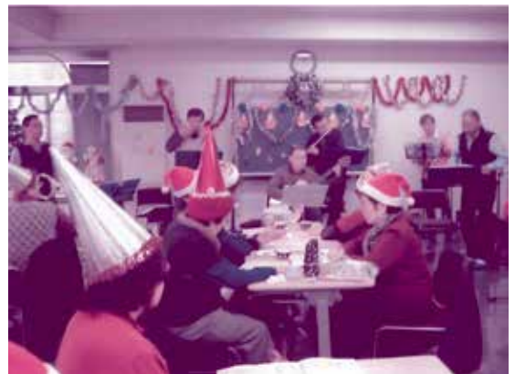
音楽を聴きながら至福のひととき (ふれあいサロン井野むつみ会) 12月14日 井野公民館

身体に不自由をお持ちのすべての方に届けたいサービス ～いつまでも心身共に明るく元気に～