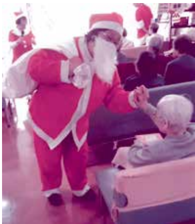
老人ホームクリスマス会に参加(はとの会) 12月16日 北相寿園

また、一人暮らし高齢者世帯・母子父子世帯・重度身体障害者世帯・重度の介護者世帯の方々にも、配分させていただいております。