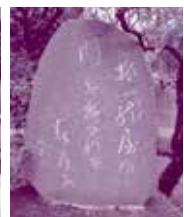
河原崎書店さん外観と敷地内にある正岡子規の歌碑 河原崎書店さん 取手市藤代502 ☎83-2044 (藤代駅北口から徒歩約10分、藤代庁舎から5分) HP http://www.kawarazaki.net/ 日曜・祝日定休