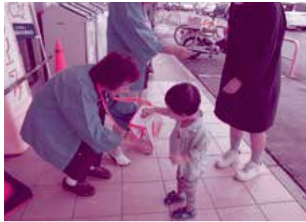
10月3日ヤオコー青柳店 (サロンかたらい)