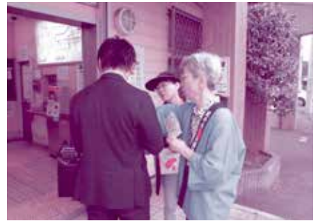
常総線寺原駅 (地域女性団体連絡会)