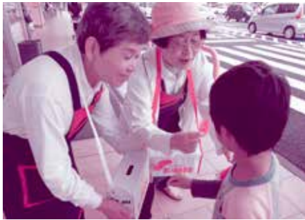
10月3日ヤオコー藤代店 (はとの会)

今年も各駅やスーパーなどのご厚意で、地域のボランティアさんのご協力をいただき、街頭募金を実施しました。参加して下さった皆さん、募金にご協力いただいた皆さん、ありがとうございました。