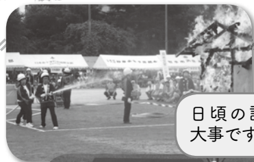
日頃の訓練が大事です!