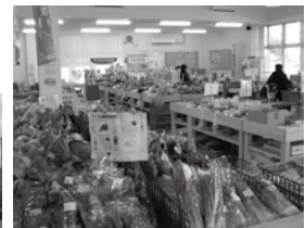
JA夢とりでさん外観と店内