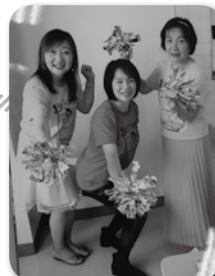
楽しいひとときをお届けしています♪