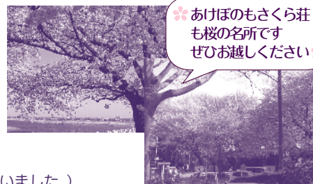
あけぼのもさくら荘も桜の名所です ぜひお越しください

*当選者の発表は景品の発送をもって代えさせていただきます。(前回の答えは①取手市福祉交流センターでした。たくさんのご応募ありがとうございました。)