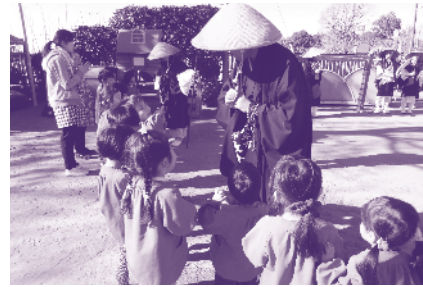
歳末募金協力 取手市仏教会の皆さん(托鉢)