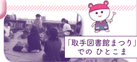
「取手図書館まつり」でのひとこま