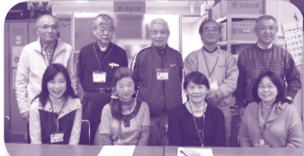
点訳・音訳サポーターの皆さん