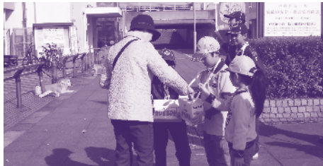
街頭募金協力 ボーイスカウト取手第3団の皆さん (マスダ戸頭店)