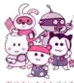
助けあいゆまちづくり

駐車場が混雑しますので、バスや電車などの公共交通機関や、自転車、徒歩などのご来場にご協力をお願いします。