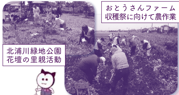
おとうさんファーム 収穫祭に向けて農作業