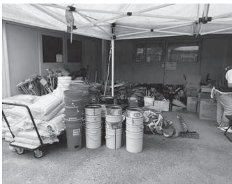
安浦地区サテライト資材置き場と 現地の土砂崩れ等の様子 (復興には時間がかかる模様です)

その中でボランティアさんの活動としては、主に民家のせまい床下や、庭からの泥出しや、清掃作業が行われていました。地域に詳しい地元の方がボランティアさんを現場まで送迎する送迎ボランティアをおこなったり、遠方から来て活動してくださるボランティアさんも数多くいて、安浦地区の復興のため、地域住民の力となっていました。