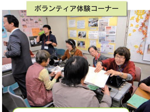
ボランティア体験コーナー