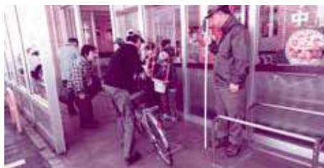
街頭募金協力 ボーイスカウト取手第3団の皆さん (ヤオコー戸頭店)