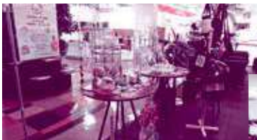
かわいい商品もたくさん!

コーヒー 240円、カフェラテ270円他、おいしいランチ700円もあります。またクッキーや手工芸品の販売コーナーもあり、ゆったりと過ごせるスペースになっています。ぜひ一度訪れてみてはいかがでしょうか。