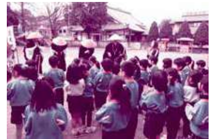
歳末募金協力 取手市仏教会の皆さん(托鉢)