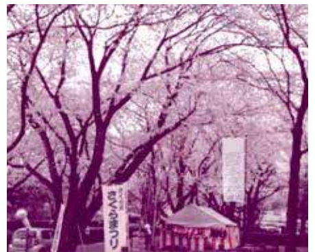
＊桜開花中は夜9時までライトアップ！

焼きそばやカレーなどの模擬店や手工芸品、みなかみ町物産品などの販売、演芸の披露など盛りだくさんの内容でお待ちしています。(演芸は11時～15時まで)