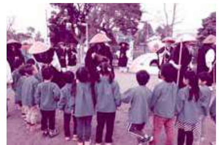
歳末募金協力 取手市仏教会の皆さん(托鉢)