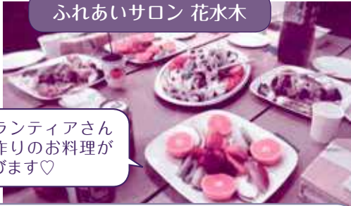
ふれあいサロン 花水木

歳末助け合い募金にご協力をいただきありがとうございました。皆様からいただいた貴重な募金の一部は、ボランティア団体やNPO団体などが12月から1月にかけて行うさまざまな事業に配分され、地域の高齢者・障がい者・市民の方々が参加し、交流できる場に有効に活用されています。また、70歳以上の一人暮らし高齢者世帯・母子父子世帯・重度身体障害者世帯・重度の介護者世帯の方々にも、配分させていただいております。(歳末配分額等、詳細は5頁をご覧ください。)