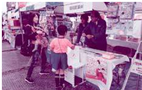
赤い羽根共同募金協力 昭和産業(株)さん(産業まつり)