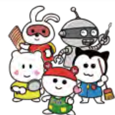
助けあいのまちづくり