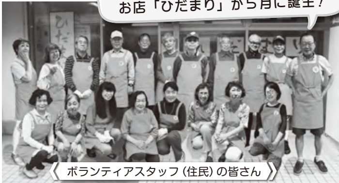
▶ ボランティアスタッフ(住民)の皆さん ◀

商店の撤退が相次ぐ西地区の窮状を救うため、中央タウンの住民の皆さんが立ち上がりました。生活の利便性向上の一助にと、お店「ひだまり」を開店、住民有志がボランティアとしてお店を開いています。取手産を中心とした新鮮野菜、お米、お弁当、卵、焼き立てパン、お菓子、レトルト食品、調味料、日用雑貨品などなど商品も多彩です。住民の方からは「助かる」「皆さんに会えてほっとする」などの声が寄せられています。