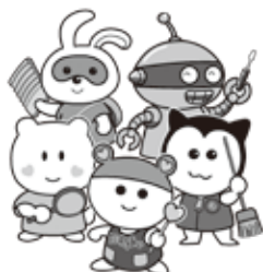
助けあいのまちづくり