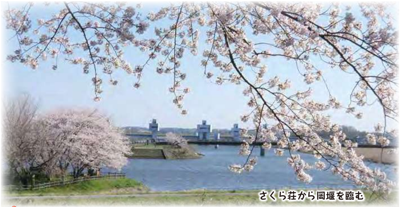
さくら荘から岡堰を臨む