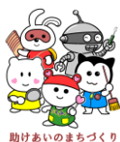
助けあいのまちづくり